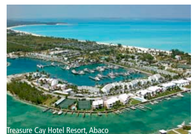
Treasure Cay Hotel Resort, Abaco